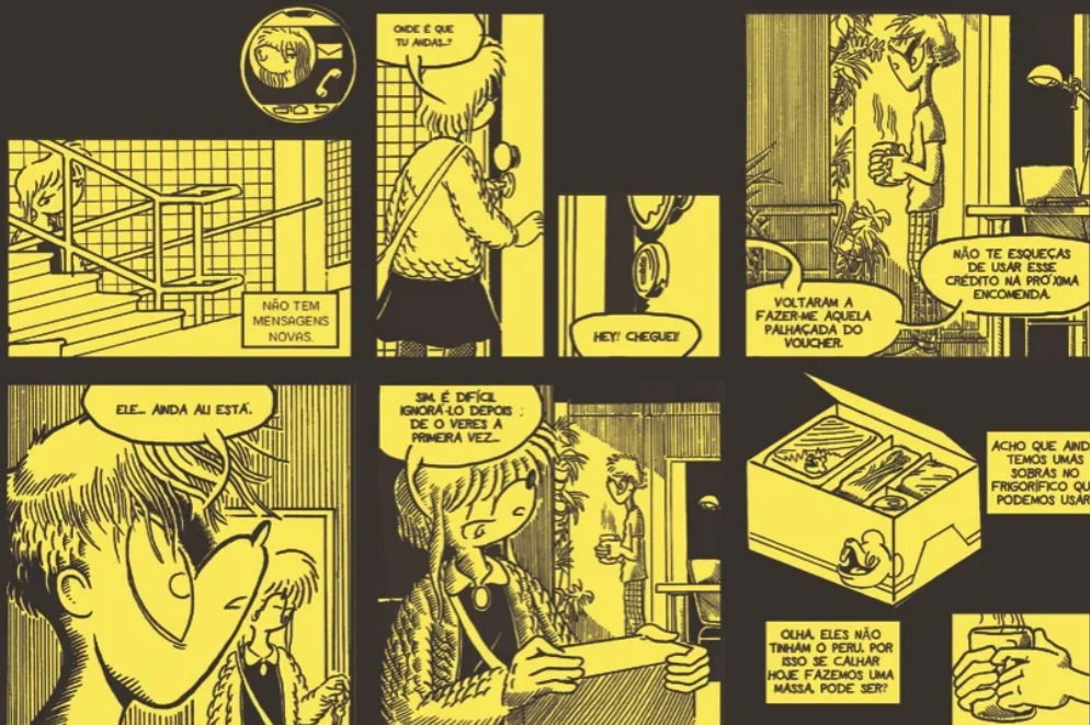
André Pereira (2015). Madoka Machina, 1. Lisbonne: Polvo