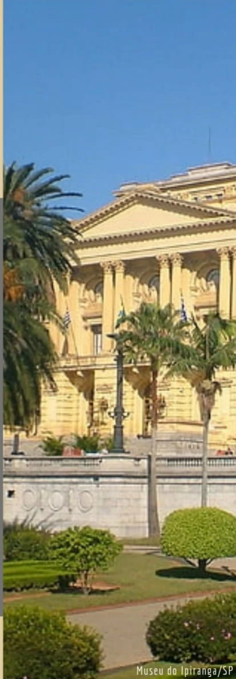
Museu do Ipiranga/SP